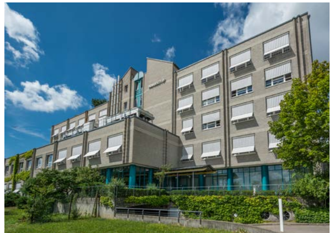
Novotechnik Ostfildern-Ruit, Produktionsgebäude