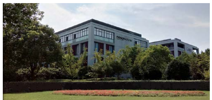
Novotechnik Sensors Trading (Shanghai) Co., Ltd., Partner für China und Vietnam