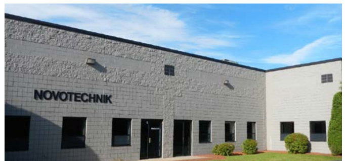
Novotechnik U.S., Southborough - Partner für USA, Kanada und Mexiko

Mit diesem Netz der kurzen Wege können wir gewährleisten, dass unsere Kunden überall in der Welt erstklassig betreut werden.